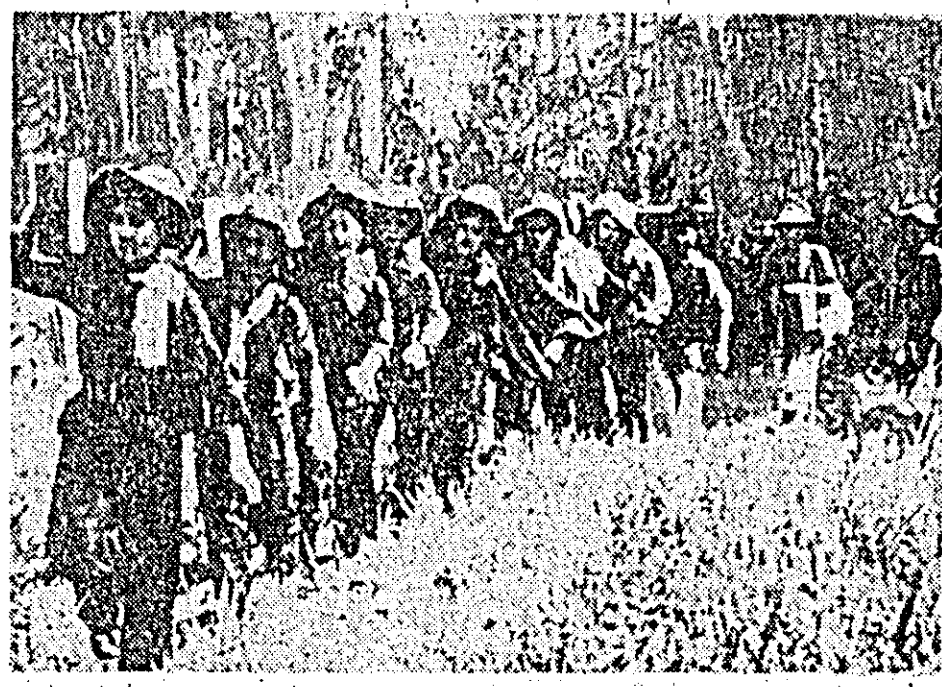
O coloană de tinere sud-vietnameze, membre ale unităților auxiliare ale forțelor patriotice, aprovizionnd pe luptători.

În acest context, încheie declarația, atacarea Hanoiului și a suburbiilor sale la 25 octombrie dovedește, fără ținută, de îndotă, caracterul fals al recentelor declarații ale președintelui Johnson în legătură cu „dorința de pace a SUA”.