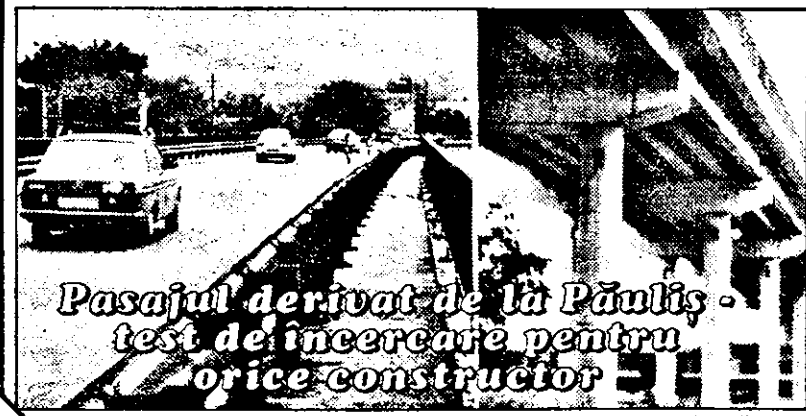
Pasajul derivat de la Păuliș - test de încercare pentru orice constructor

Dacă e să vorbim de construcții, atunci neapărat trebuie să începem cu Conar S.A. Pentru simplul motiv că după 1989 aproape toate lucrările de construcții de mare anvergură din județul nostru au fost executate de această societate. La concret, amintim Fabrica de seringi Sanevit, Centrul de dirijare a zborurilor, Vama Vârșand - ca antreprenor general, Vama Nădlac - lucrările de specialitate, DN 7, pasajul derivat Păuliș, Grupul nr. 1 al CET-ului pe lignit etc. În curs de executare, tot în dreptul Conar-ului, se poate reține Baza de producție și administrație gaze naturale Timișoara, Grupul II al CET-ului pe lignit, Spitalul orașenesc Ineu etc. C. TRIF (continuare în pagina 3)