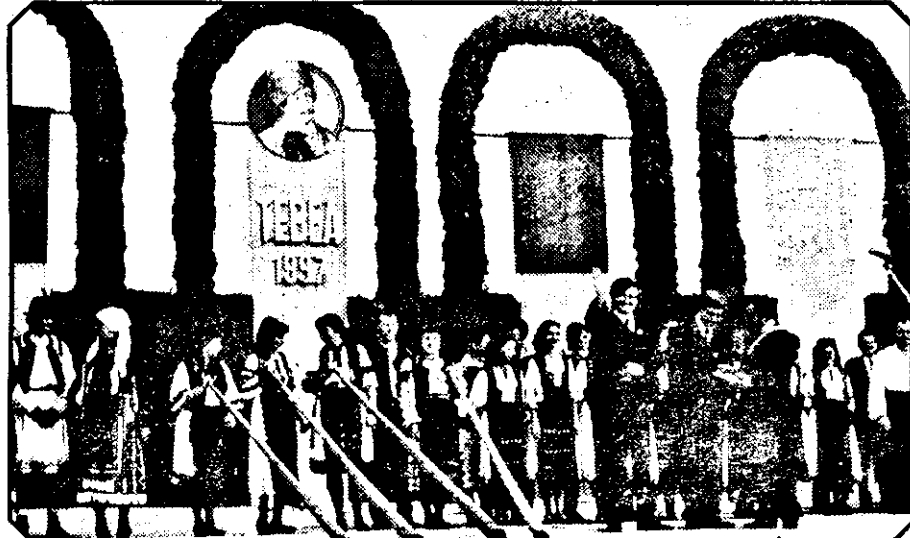
Huiduit de moți, „moțul” Ciorbea s-a făcut că n-aude și nu vede nimic. Și ne zâmbea...

• Mii de jandarmi, pe platoul de la Ţebea • Opoziția n-a avut cuvinte • În câteva luni, tot moțul va avea telefon celular • Marioara Murărescu face dedicații premierului Ciorbea • Mulțimea huiduie Puterea • Ciorbea trăiește cu impresia că a fost huiduit de extremiști.