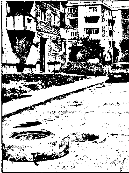
O capcană - ca zecile prin Arad dar care nu deranjează pe nimeni, inclusiv sau, mai ales, Primăria.

De menționat că pentru anul în curs taxele de mai sus sunt reduse la aproape jumătate, în funcție de perioada 1 august 1997 - data apariției hotărârii de Guvern și sfârșitul anului.