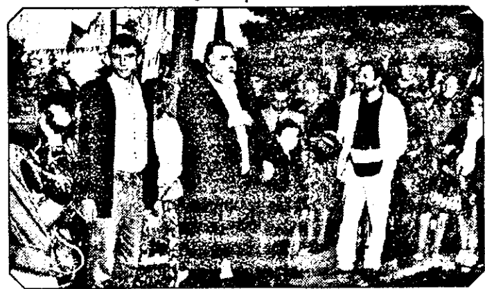
Singurul care a coborât în mijlocul oamenilor, fără gardă de corp, a fost Adrian Păunescu.