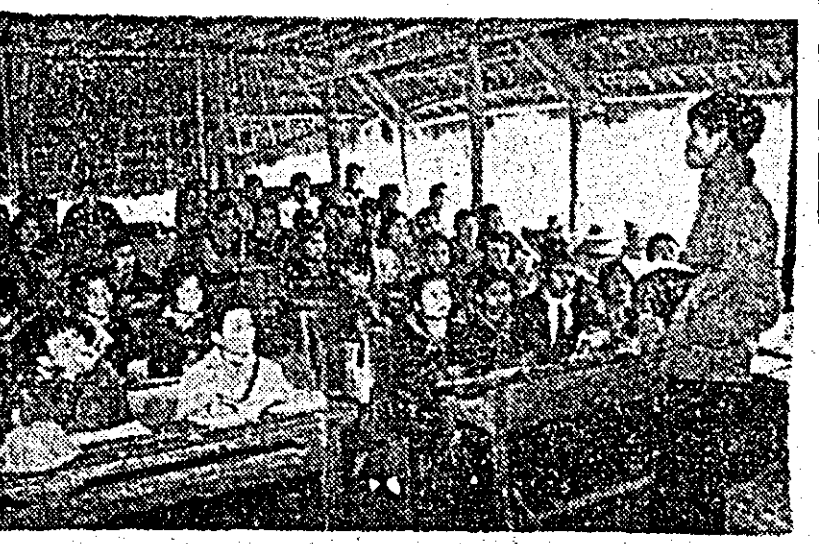
R. D. Vietnam: Iată condițiile în care se învață, în urma evacuirii localităților vesnic bombardate de aviația americană.

S.U.A. la conversațiile oficiale de la Paris, care neagă că bombardamentele americane vizează distrugerea de vieți omenești și pagube materiale populației, Comisia centrală a R.D. Vietnam aduce dovezi că aviația americană nu a încetat să atace centre economice culturale și sisteme de irigații și diguri. Concomitent cu aceste atacuri violente asupra regiunilor populate, se subliniază în comunicat, imperialismii americani continuă să comită și alte acte de război împotriva R.D. Vietnam: zborurile de recunoaștere în spațiul aerian a 14 provincii, precum și asupra orașelor Hanoi și Hai Phong, atacarea litoralului de către flota a șaptea. Numărul obuzelor trase numai în 15 zile se ridică la 30.000. La recenta sesiune a Adunării Naționale a R.D. Vietnam, deputații din provinciile situate între paralelele 17 și 20, unde bombardamentele americane continuă, au relevat că „după ce Casa Albă a dat dispoziție de limitare a bombardamentelor aeriene, provinciile lor au fost și mai intens bombardate. Aceasta este o manevră extrem de perfidă, și în același timp barbară, a spus Nguyen Xuan Linh, deputat din provincia Ha Tinh, care a încheiat că prin forța bombardează poate să înfrângă voința noastră, hotărârea noastră de a învinge pe agresor, dar se înșală amarnic”.