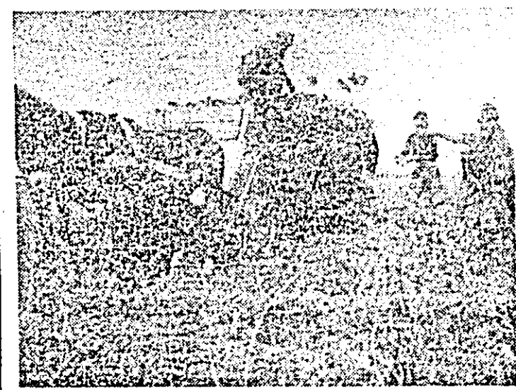
C.U.A.S.C. Felnac. La transportul sfeclei de zahăr din cîmp sînt antrenate numeroase atelaje hipo.