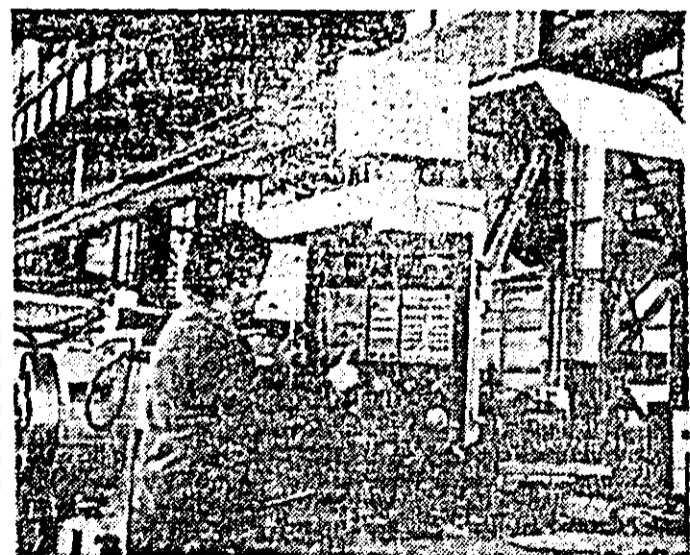
Aspect de muncă din secția montaj a I.M.U.A.

Pentru oamenii muncii din cadrul întreprinderii mecanice pentru agricultură Arad, introducerea în fabricație a noi mașini și utilaje agricole, care să contribuie la mărirea gradului de mecanizare a agriculturii românești, este o activitate permanentă căreia li se acordă o atenție deosebită. Dintre ultimele noutăți create și asimilate în producție de muncitorii și specialiștii unității amintim zdobitorul de în cu 13 perechi de valțuri și pe cel cu 7 perechi, zdobitorul pentru tulpini de cîneapă cu 23 perechi de valțuri, meliță pentru în cu un post și patru posturi, remorcă de mare capacitate pentru transportul tulpinilor de în și cîneapă, instalația de sortat tomate tip „Dumbrăveni”, grapa rotativă și altele. Ponderea producei lor noi și modernizate în totalul producției marfă pe primul trimestru I a ajuns la 56,7 la sută față de 43 la sută cit era planificat.