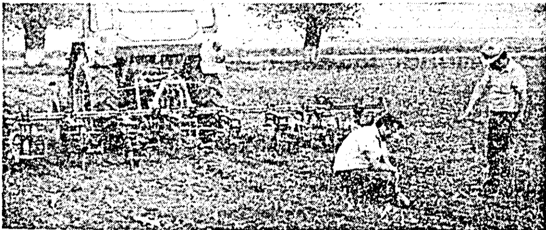
Pe terenurile C.A.P. Comlăuș se execută prașitul mecanic la porumb.