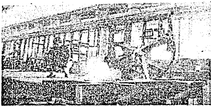
I.V.A. fabrica de vagoane pentru călători. Și în atelierul montaj-sudură activitatea productivă se desfășoară în ritm susținut.