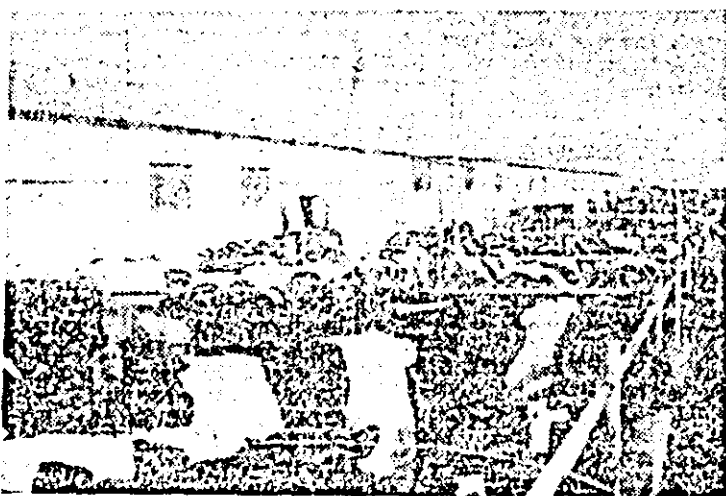
Ferma nr. 10 de bovine a I.A.S. Șagu are posibilități să sporească producția de lapte în anul viitor cu 700 litri pe vacă, față de acest an.

Imaginea necorespunzătoare de la Șagu a redevenit însă plăcută la cooperativa agricolă din Vinga. Aici efectivul de bovine e realizat și depășit, producția totală de lapte pe 10 luni se ridică la aproape 10000 hl, sporul de creștere în tineret se depășește, la fel natalitatea, astfel că efectivul mătăc se împrosptează numai