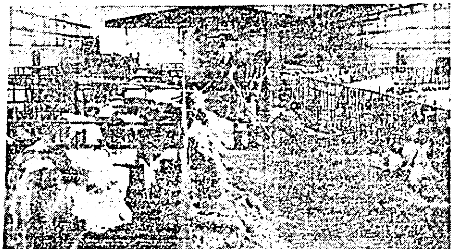
Pagină realizată de A. HARSANI