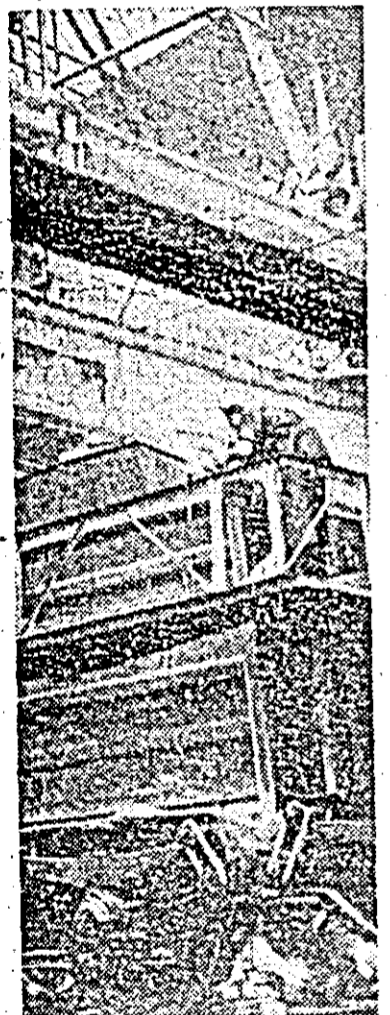
Aspect din secția montaj-sudură a Uzinelor de vagoane.