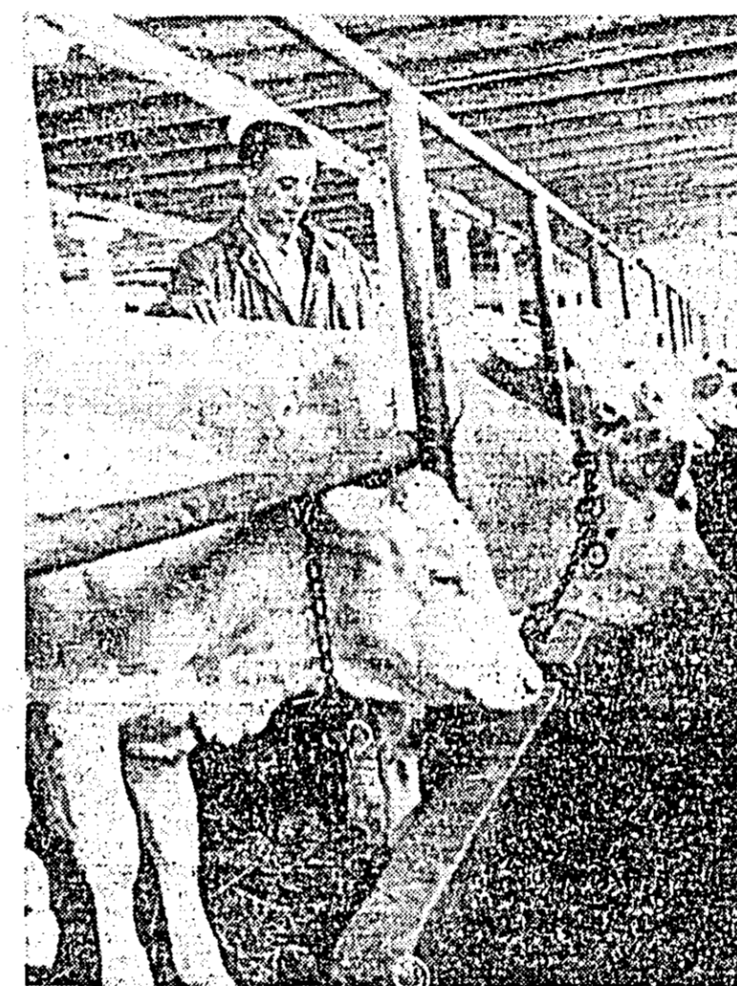
In sectorul zootehnic al cooperativei agricole de producție Macea.