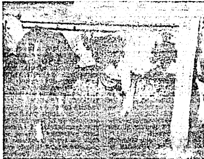
Decît pe un asemenea „așternut”, nu e de mirare că animalele de la C.A.P. Birsă preferă să se odihnească... în pîcleare.

și în exteriorul grajdurilor absența mîinii bunului gospodar se observă la fiecare pas. Dintr-o imensă grămadă de gunoi de grajd formată de-a lungul anilor s-a transportat în