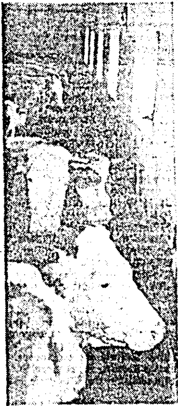
Construite impropriu, instalațiile de alimentare cu apă din grajdurile fermei Chisindia îngreunează accesul animalelor la adăpători.

proprie de alimentare cu apă care, datorită înălțimii și distanței față de animale, îngreunează accesul acestora la adăpători și despre administrarea furajelor întregi și necocate, deși ferma dispune în acest scop de o moară furajeră, aflată în stare de funcționare. Și totuși, semne de îmbunătățire a activității există. Ne referim la faptul că pentru actuala perioadă de stabulație au fost asigurate cantități sporite de furaje și că, prin recenta unificare a cooperativelor agricole din Chisindia și Buteni, noua unitate — C.A.P. Buteni — dispune de o bază tehnică-materială și putere economică sporite și de un nou președinte înimos și entuziast, hotărît să îndrepte actuala stare de lucruri, să redă fermei zootehnice Chisindia un loc pe măsura tradițiilor existente în această zonă în ce privește creșterea animalelor. Preocupări care vor trebui îndreptate și spre îmbunătățirea activității din ferma zootehnică Buteni a aceleiași cooperative (sef de