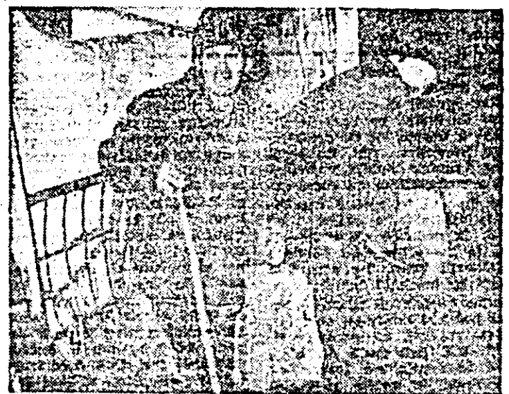
La C.A.P. Birsă, la ora 18,35, nu mai erau prezenti în ferma zootehnică decît cei doi paznici de noapte.

grafe Inocou. C 45, 14, 1 Răz bunare Orele 1 8, 20. Procesu cerg. Serii 9,30, 13,1 Casa me verde. O ATEA: Lu gul fluviu 19. Alarmă 16, 18. DET: Cap și' pa Tentălia RIS: Mira DLAC: Pa entru trel. secretul sis alarmă. PE acterizarea Seherzada. il de clasă. unel actri Un om pe ATA: Dum lie. DE STAT antă azi, 6 ora 19, cu piesa de Robert NICA DE prezintă în l cultural, uarie 1989, concert sim br: CAROL ști: VALE CEV și ION In pro așescu — viară și fima audi Beethoven — tru pian și 5; Mu avel — Ta expoziție. une urnal; 19,23 Inăptuirii ăi agrare, de glorioasă Laureați a naționa României" mint — cer producție serial: „Ne ultimu Chimia și tomâneasc 21,50 Te obabil fi în go și închis mai mult câdea pr mai alc de ninsoa suffla sl din sud-c intensific la 40 km/ e minim se între au cele m -1 și ceată.