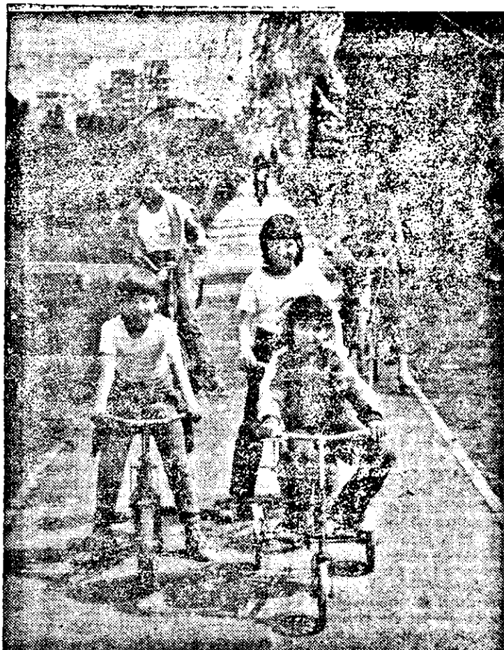
Zile de vacanță pe malul Mureșului.