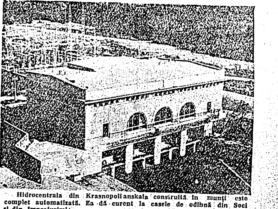
Hydrocentrala din Krasnopolnanskaja construită în munți este complet automatizată. Ea dă curent la casele de odihnă din Soci și din împrejurimi.