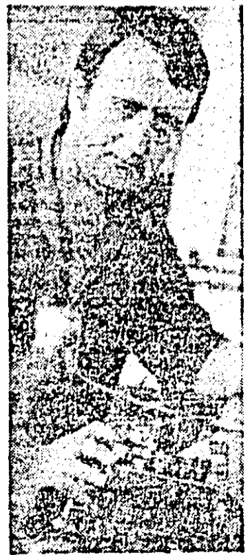
Secția de producție C.T. Arad: strungarul Gh. Fărcaș este unul dintre fruntașii întrecerii socialiste.