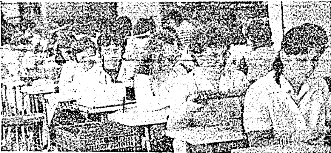
Aspect de muncă la linia de montaj ceasornice a întreprinderii „Victoria” Arad.

— La sectorul al II-lea avem un atelier de creație tehnico-stiințifică al nostru, al tinerilor din întreprindere —