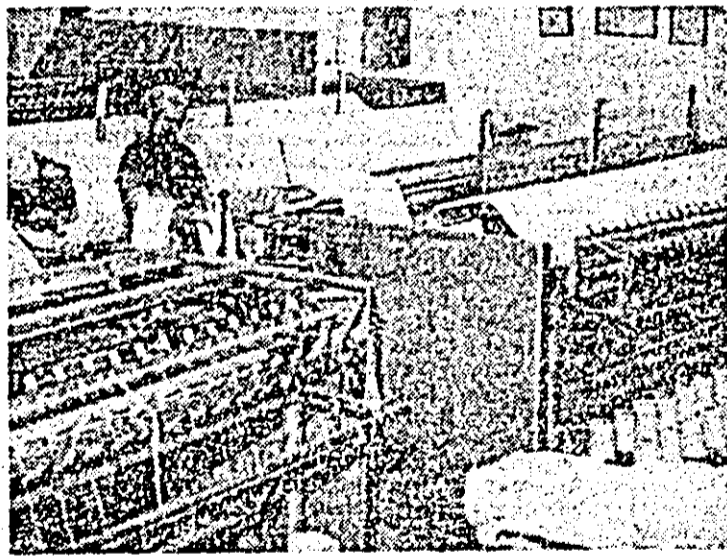
Imaghe din atelierul pregătire al țesătoriei întreprinderii textile „UTA” Arad.