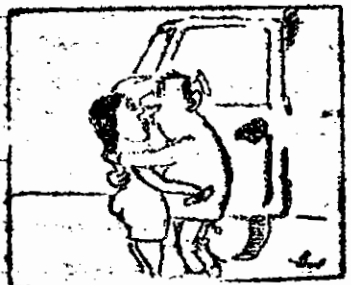
Idilă pe traseu...

Acestea sînt, pînă acum, principalele informații de care dispunem — și pe care am dorit să vi le aducem și dvs. la cunoștință — privind implementările referitoare la aplicarea prevederilor Legii fondului funciar. După publicarea legii în „Monitorul Oficial” și în momentul cînd vom cunoaște alte amănunte, de larg interes, vom reveni.