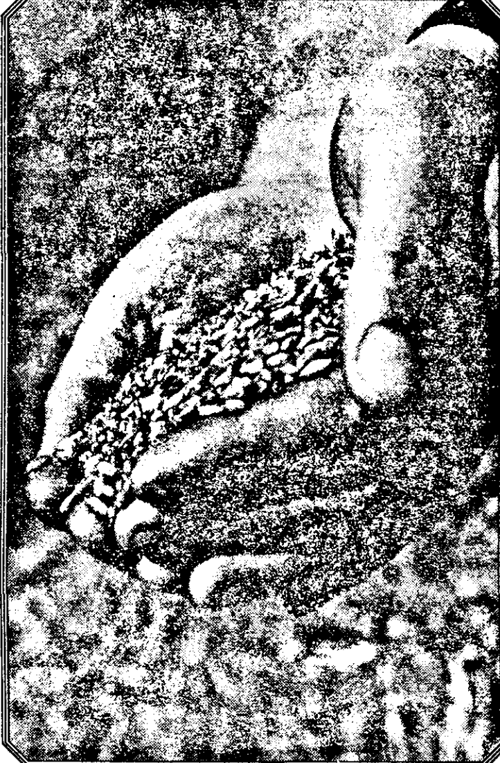
E vremea secerișului, adică a mirabilelor seminte.