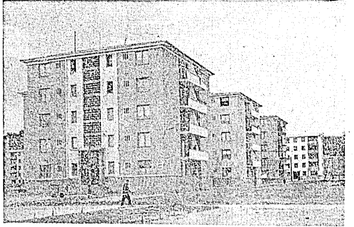
Noi blocuri de locuințe pe valea Motrului pentru minerii olteni