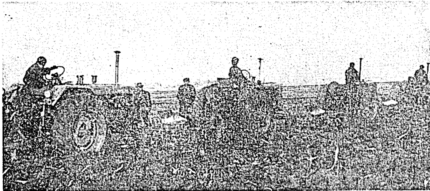
Brigada a IX-a de la SMT Aradul Nou execută arături adânci pentru însămânțările de primăvară pe ogoarele cooperativei agricole din Bujac.

acestora e prea mic, putând fi numărate pe degete. Marea parte a cooperative-lor mai au de arat sute de hectare, așa cum, e cazul, de pildă, la Curtici, Macea, „Victoria” Nădlac, „Avintul” Pecica, Peregul Mare, Zimandul Nou unde stadiul arăturilor e inferior comparativ cu media raionului. Deși la Curtici există un număr mare de tractoare în decurs de o săptămână nu s-au arat decât aproximativ 90 de hectare la fiecare cooperativă, iar la Macea și mai puțin. Nesatisfăcător stau lucrurile și la Șofrona și Zimand. Că se poate face mai mult ne-o dovedesc realizările obținute, tot pe parcursul unei săptămâni, la alte cooperative. Așa, bunăoară, la Covășinț s-a reușit să se are 145 hectare, făcându-se astfel un pas însemnat spre grăbirea terminării lucrărilor. Este inutil să mai amintim avantajele arăturilor executate în toamnă deoarece experiența altor ani a confirmat pe deplin prin recoltele dobândite importanța lor. Ceea ce se cere acum este impulsivitatea lucrărilor, acolo unde e cazul să se elibereze terenul de resturile culturilor, să se ajungă la un ritm sporit de lucru ca recolte viitoare să i se asigure condiții optime de producție.