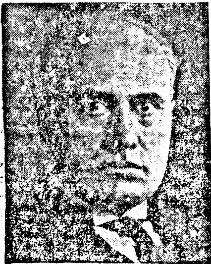
MUSSOLINI olasz kormányelnök.