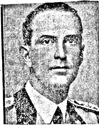
UMBERTÓ olasz trónörökös