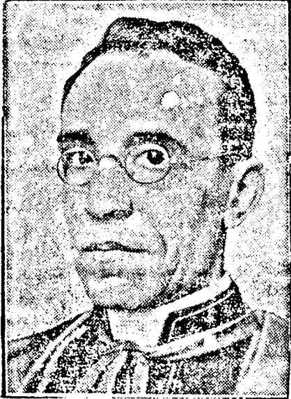
XII. PIUS PÁPA