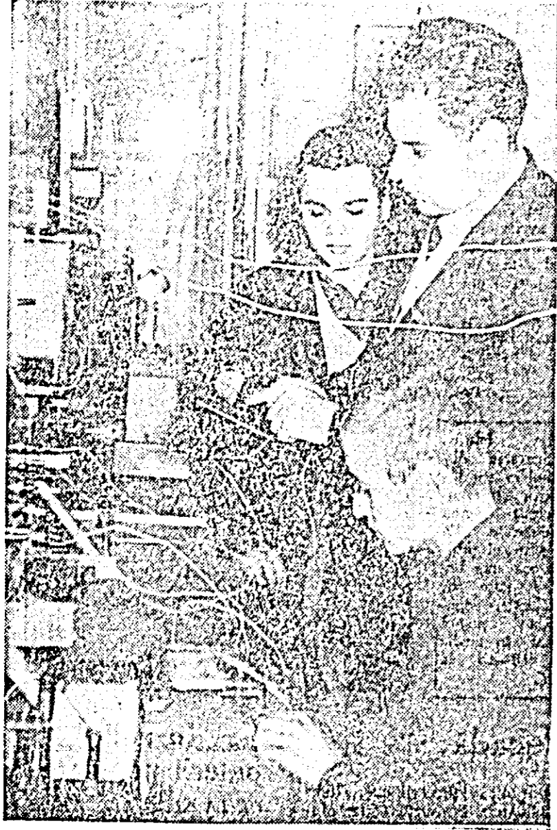
IN CLIȘEU: o oră de laborator la Școala profesională a Uzinelor de vagoane.