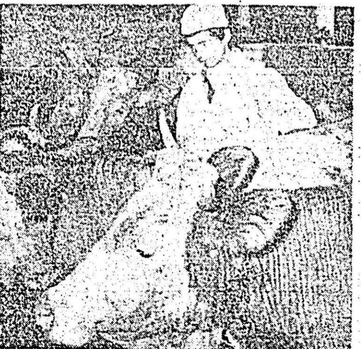
Exemplare valoroase pot fi văzute și la ferma zootehnică a C.A.P. Turnu.

mele științei agrozootehnice, activitatea este eficientă și din punct de vedere financiar.