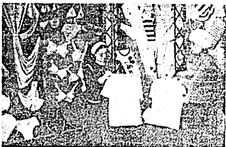
Întreprinderea „Tricolor roșu”. Aspect din expoziția cu produse ale întreprinderii.

• La Praga s-au încheiat lucrările ședinței largite a Prezidiului Consiliului Mondial al Păcii, la care au participat aproximativ 400 de delegați. Au fost dezbatute