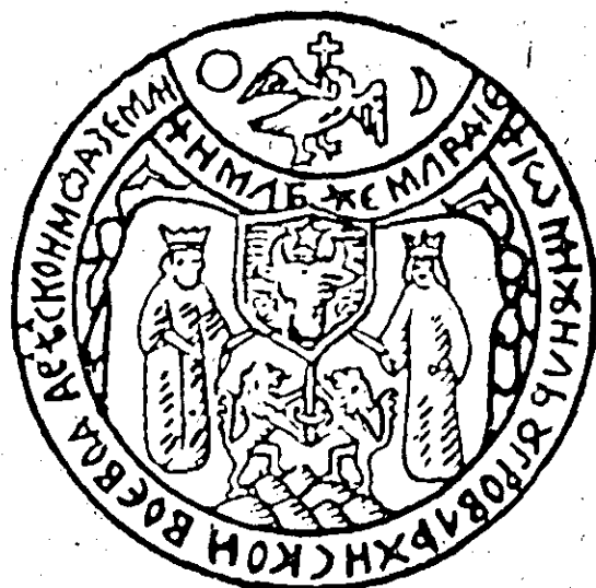
Sigiliul țărilor române unite de Mihai Viteazul.

ma campanie a lui Mihai Viteazul în Transilvania, campanie care a avut ca moment culminant bătălia de la Șelimbreg. Oastea Țării Românești a pătruns în Transilvania prin două