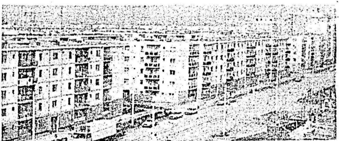
Imagie din noul și modernul cartier arădean — Micăleca.

Informații suplimentare, la telefon 18490, interior 25, birou comercial II. (716)