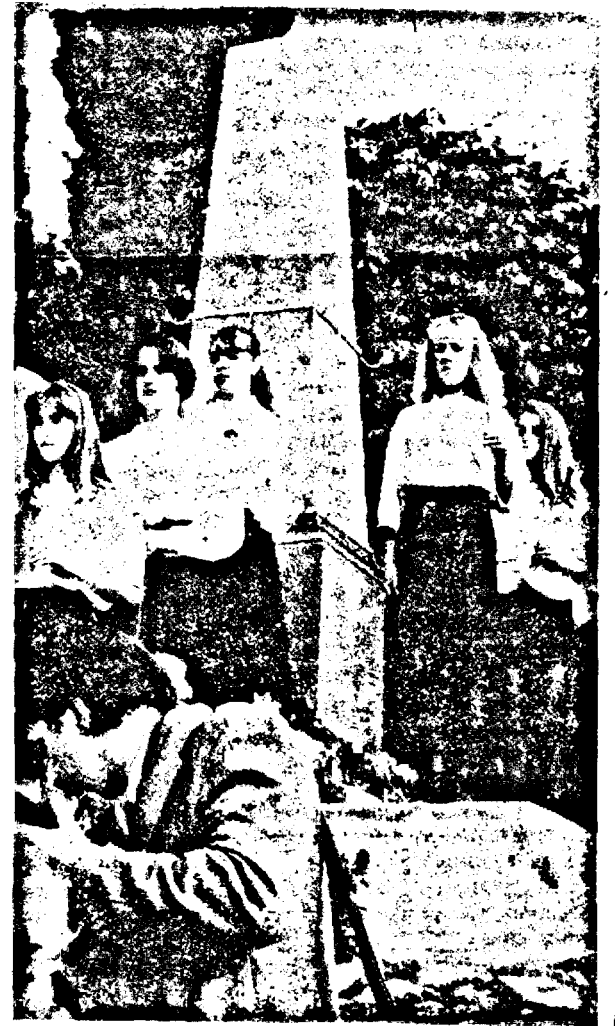
Moment de la depunerea de coroane

Această zi însă a scos în evidență faptul că, pentru popoarele română și maghiară, există multe momente în istorie care pun probleme în ceea ce privește reconcilierea. Cel 13 generali, care au condus armatele revoluționare, au semănat teroarea în rîndul populației românești. Ceea ce pentru unguri este titlu de glorie, se vedește pentru români a fi motiv de jale. Istoria noastră comună a fost plină de asemenea momente. Nu se poate porni la reconciliere, fără a încerca să depășim ceea ce ne dezbină. Aceasta este soarta noastră. Maghiarii au chemat românii să vină alături de ei, în această zi, pentru a se ruga pentru sufletul tuturor celor care au pierit în acele vremuri tulburi de demult. Însă, fiecare, în adîncul sufletului său, și-a amintit de morții săi, uciși de către ceilalți. Poate, nu aceasta este calea adevărată a concilierii. Trecutul trebuie