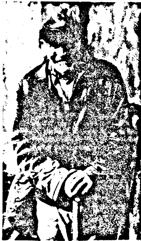
TATĂL VICTIMEI, PĂTRUNS DE DURERE ÎN FAȚA DECESULUI TRAGIC AL FIULUI SĂU

două săptămâni înaintea crimei, tatăl său l-a scos de la Mocrea. Însă Robert a fugit la mama sa, la Hunedoara (părinții săi trăiesc despărțiți de mulți ani). Chiar în ziua când urma să meargă după el, tatăl său s-a trezit cu băiatul acasă, la Ghioroc. Era ziua de marți. Seara, pe la orele 21, 30, vecinii au auzit strigăte și zgomot de luptă dinspre locuința lui Urban. Nimeni