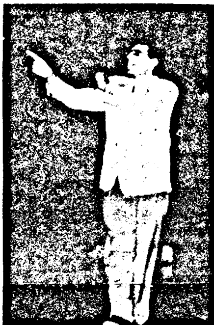
MULT PREA NERVOSUL ANTRENOR AL OASPETELOR DIRIJIND JOCUL ELEVELOR SALE