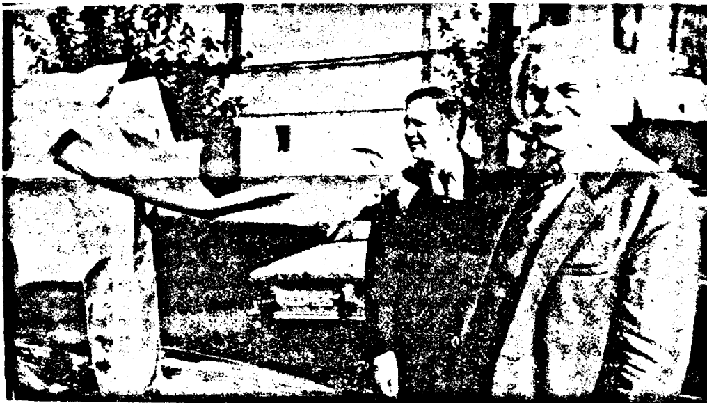
Domnul Tamas Katona, secretar de stat al Republicii Ungare