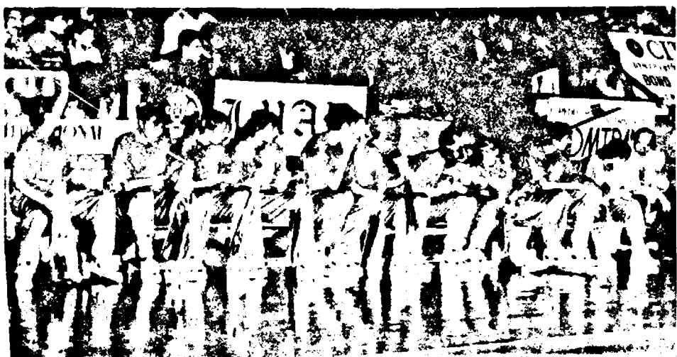
BASCHET CLUB ARAD, GATA DE START