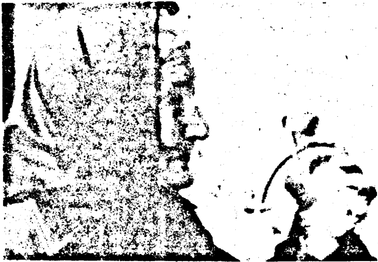
MAMA VICTIMEI ESTE CONVINSĂ CĂ NEPOTUL EI, PE CARE L-A CRESCUT PÎNĂ LA VÎRSTA DE 10 ANI, ȘI-A UCIS TATĂL