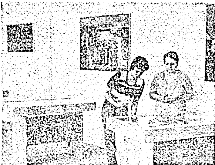
Aspect din expoziția de carte veche românească deschisă la Biblioteca Județeană Arad.