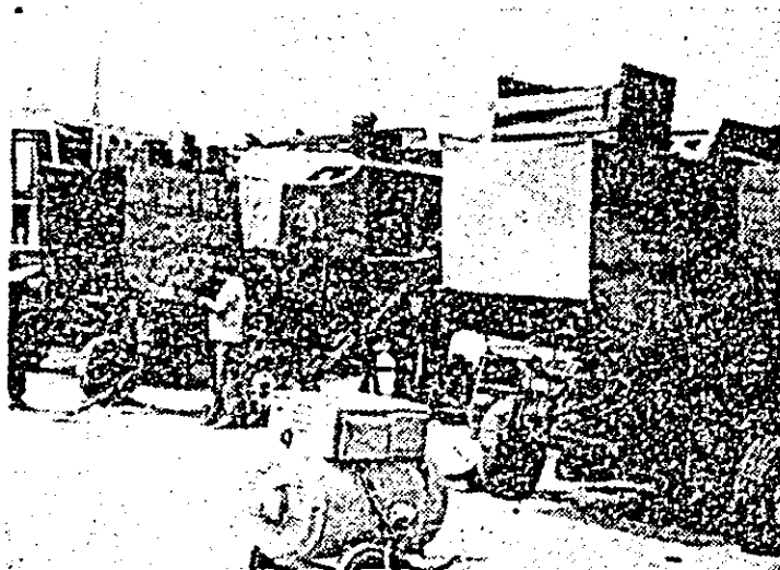
În consiliul agroindustrial Sintana se fac ultimele pregătiri la combine înainte de a intra în lan.