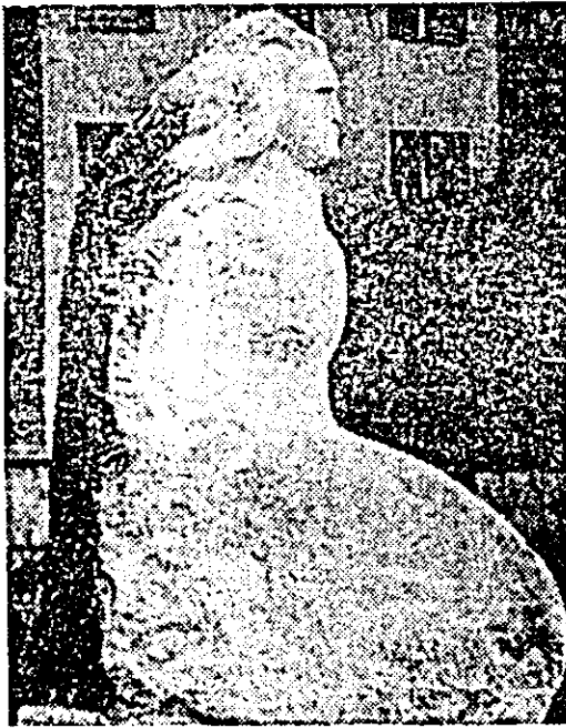
Ioan Tolan Tinerete.

Interferența umanismului cu patriotismul este un lucru firesc deoarece primul este alimentat de sentimentul de dragoste față de patrie și față de popor, notat ca un fenomen social-istoric, avînd în diferite