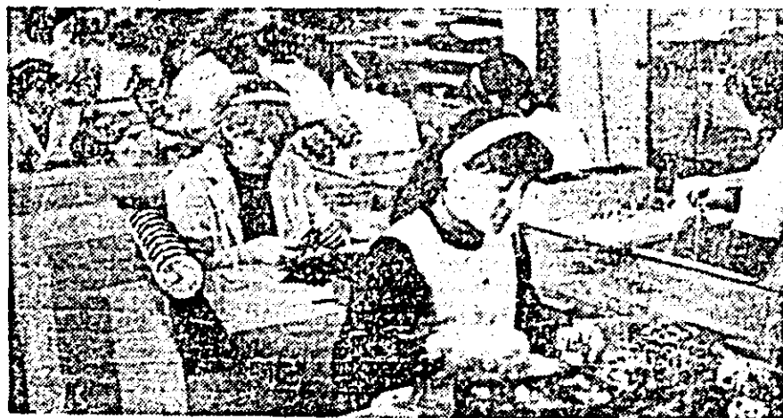
Aspect de muncă în atelierul montaj al întreprinderii de ceasuri „Victoria”, unul dintre colectivele fruntașe în întrecerea socialiste.