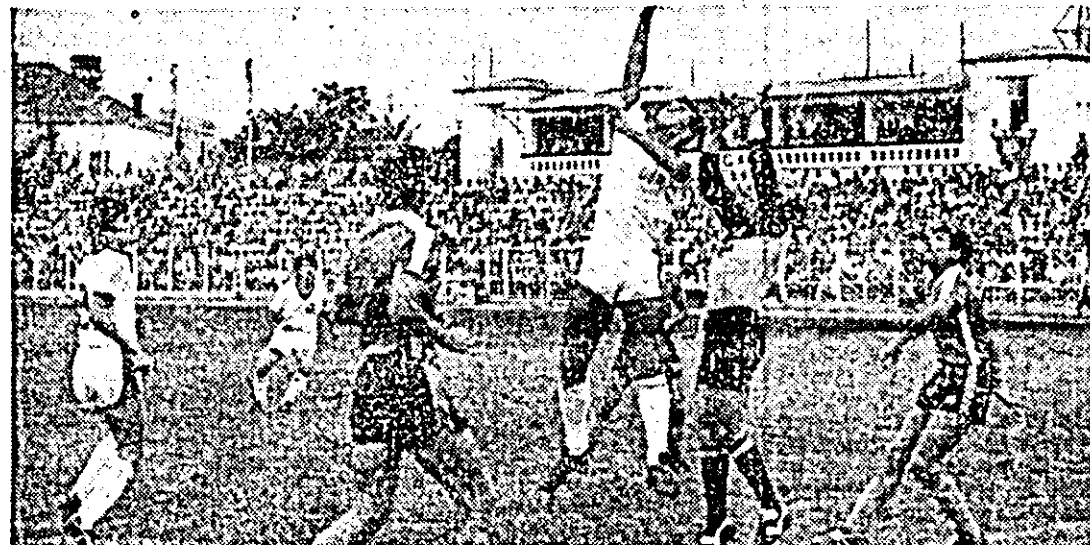
Fază din meciul de fotbal UTA - Armătura Zalău.

capul pe lângă stîlpul porții șutul-centrare al lui Cheregi, prin Nagy (min. 69) sînt peste poartă și prin Vuia (min. 79), reluare cu capul pe lângă stîlpul porții. UTA a câștigat meritat un joc pe care l-a dominat permanent (8-0 cornere, 23-6 șuturi la poartă, 11-3 șuturi pe spațiul porții), găsind destul de ușor drumul spre poarta adversă pînă în minutul „cheie” amintit. Meciul a fost condus bine de o brigadă din Reșița formată din Ladislau Vörös, la centru și Constantin Mandă și Adrian Cuzmanovici, la tușă.