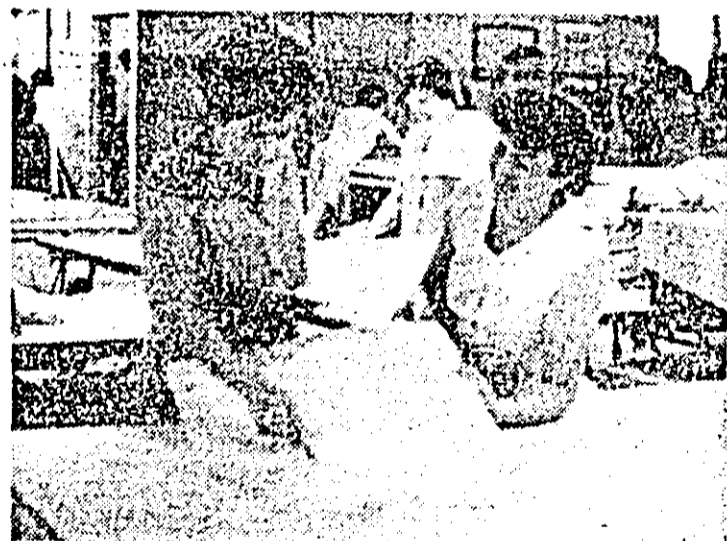
Întreprinderea „Tricoul roșu”. Aspect de muncă în atelierul de croit.