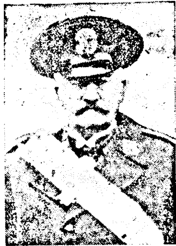
D. Consilier Regal Al. Vaida-Voevod

Aceștiuna pornește din lăuntru în afară. Imaginați-vă mai multe raze de lumină plecate din pretutindenitatea țării, adunate într'un focar cu ajutorul