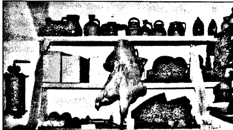
Depozitul secției de istoric, încărcat de obiecte.

sau sfârșitul anului, ceea ce îngreunează foarte mult procesul de cumpărare de noi valori muzeale, oferta fiind făcută în ianuarie-februarie, banii vin destul de târziu, deci... ofertantul așteaptă și iar așteaptă. Anul trecut, când din punct de vedere financiar depindea de Consiliul Județean Arad, muzeul a primit aproximativ 172 de milioane de lei pentru investiții, pentru dotări cu calculatoare și aparatură video-foto - 27 milioane lei, iar pentru reparații 165 de milioane. Toți banii provenind din bugetul administrației locale. Spre deosebire de anul trecut, în 1996 pentru investiții nu s-a primit nici un leu de la Ministerul Culturii, în subordinea căruia se află muzeul din luna iunie, iar pentru reparații