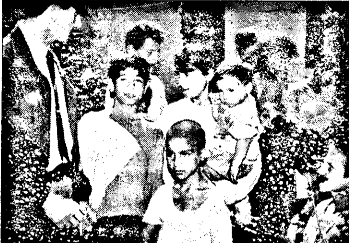
Toate drumurile duc la...Centrul de Minorii, unde „Mowgli” este „gardian sef”