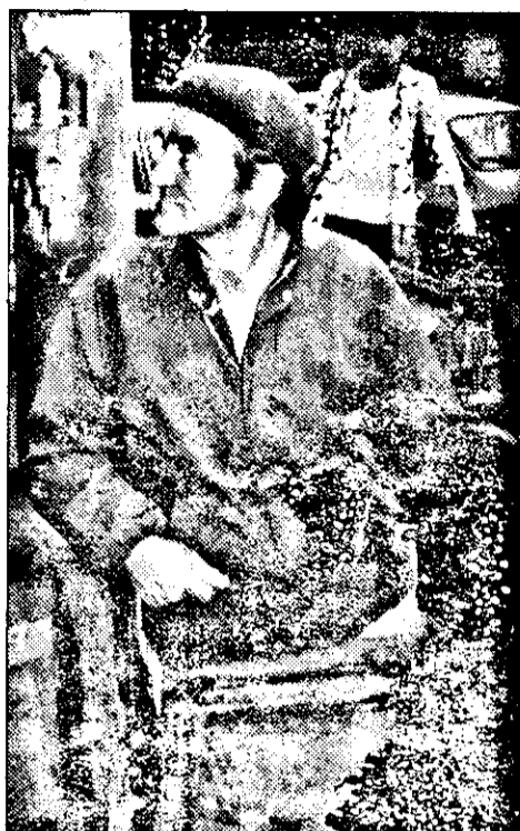
Cerșetor în schimbul unu, sau un tată cerșind pentru fiu.

nu mai știe cum să mulțumească gardienilor: „Aici suntem asaltați de vagabonzi