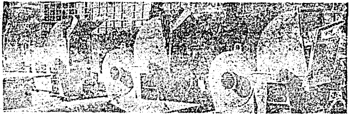
I.M.A.I.A. Primele zile ale noului an, primele livrări — un lot de mori pentru pastă.

La întreprinderea „Victoria”, priceperea și hărnicia constructorilor de ceasuri au acum noi posibilități de afirmare. Utilajele moderne intrate recent în dotarea secțiilor — printre care mașina pentru confecționat arcuri spirale prezentată în imagine — constituie factori însemnați ai ascensiunii producției întreprinderii.