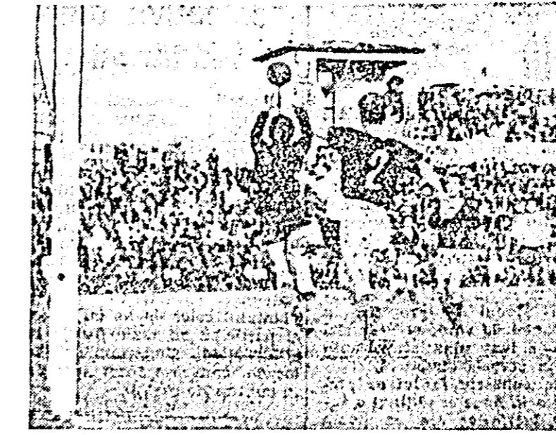
ÎN CLIȘEU: fază din meciul Dinamo Bacău-UTA

În ce privește arbitrajul prestat de G. Dumitrescu (București) a fost de slabă calitate. Și asta din următoarele motive: în primul rînd el a condus partida după „legea” sa și nu conform regulamentului jocului de fotbal. Astfel, pentru el n-au existat faulturi și hendsur, nesemnificative majoritatea lor. Din acest punct de vedere a fost privă-