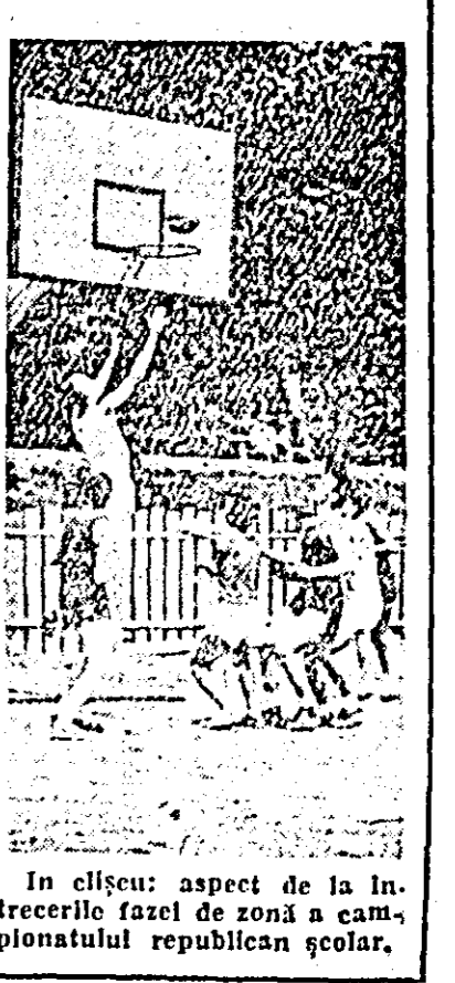
În clipșu: aspect de la întrecerile fazei de zonă a campeonatului republican școlar.