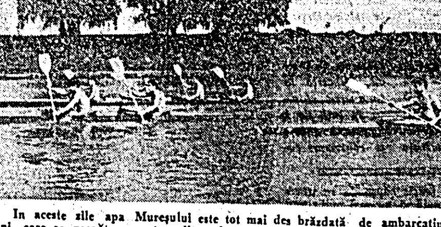
In aceste zile apa Mureșului este tot mai des brăzdată de ambarcațiunile e 1966. IN CLISEU: un aspect de la antrenamentul calcistilor asociației Voința.

In deschiderea meciului de categoria B CFR Arad — Industria sfarmice, a avut loc partida dintre formațiile de juniori CFR Timișoara — Voința Oradea. Cele două echipe s-au întilnit pe teren neutru, meciul avînd un caracter oficial cu destulă importanță: feroviarilor timișoreni sînt deținătorii locului II în seria în care au activat în cadrul campionatului republican de juniori, iar orădenii sînt campioni regionali al Intrecerii juniorilor. Ei s-au întilnit la Arad într-un meci hotărîtor, în vederea calificării pentru turneul final al celor mai bune echipe de fotbal ale tinerilor de vîrstă junioratului.