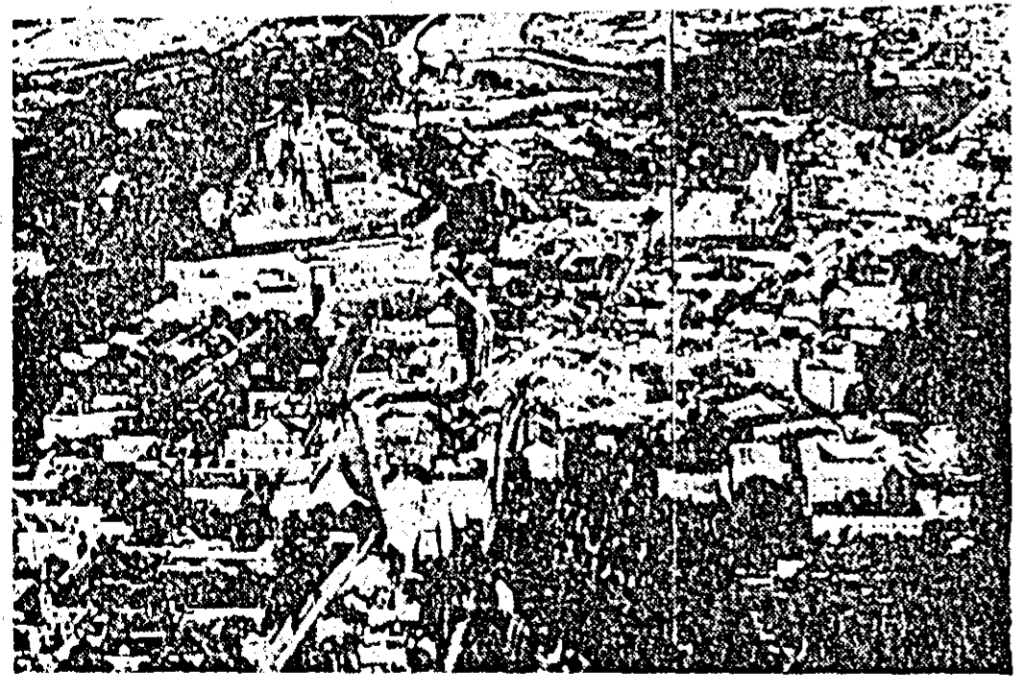
R. S. Cehoslovaca: Vedere panoramică a orașului Praga — capitala țării.

copiii, declarînd că nu o evacua pînă ce revendicările lor vor fi satisfăcute. Totodată, la Corleone (Sicilia) a fost declarată o grevă generală în semn de protest împotriva anulării reducerilor de impozite care beneficiau toate cele care au fost afectate de cutremur.