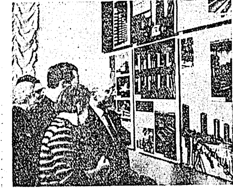
Expoziția „Arhitectură modernă a României”, deschisă recent la Casa centrală a arhitecturii din Moscova.

I. DUMITRĂSCU, Correspondentul Agerpres la Varșovia