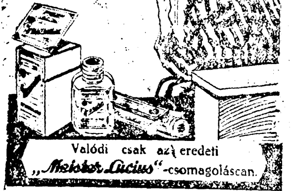
Valódi csak az eredeti „Miktor Lucius“-csomagolásban.

és a jó kedv azonnal visszatér. Ezért legyen elved: „Tarts otthon állandóan Pyramidon tablettát!“