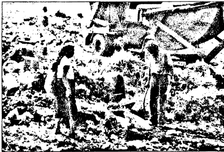
Grup de țigani „în exercițiul funcțiunii”, adică scormonind prin gunoiul adus în rampă, în căutarea sticlelor goale ori a conservelor expirate.