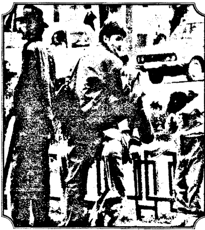
Doi pe față, unu pe... dos.