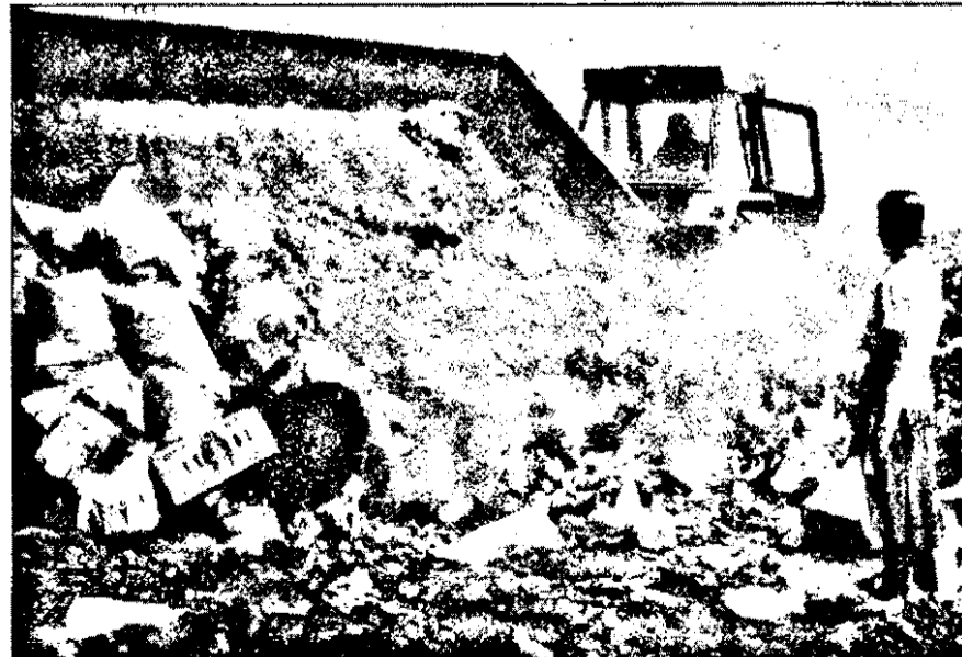
Mare bucurie! A sosit un nou „lot de marfă” ...

agenți economici, existând un permanent pericol, constând în faptul că, de regulă țiganii, dar nu numai ei, „recuperează”