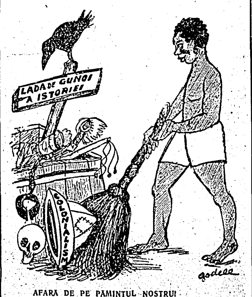
AFARA DE PE PAMINTUL NOSTRU!

în rîndurile prietenilor cîi și ale dușmanilor la această mare adunare a șefilor de state și a diplomaților de frunte din 96 de țări. Ziarul „Daily Worker” scrie că propunerile lui Eisenhower sînt nerealistice îndeosebi în domeniul dezarmării unde SUA a insistat totdeauna nu asupra dezarmării, ci asupra controlului în domeniul dezarmării. Și aceasta, scrie ziarul, este echivalent cu a cere permisivitatea de a se ocupa cu spionaj. „Această propunere a fost făcută pentru a împiedica dezarmarea, și nu pentru a asis-