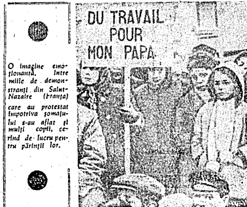
O imagine simfoniantă, între mîile de demonstrații din Salm-Nazaire (Franța) care au protestat împotriva somajului s-au aflat și mulți copii, cerînd de lucru pentru părinții lor.

Africa și America Latină, interesate în extinderea legăturilor lor comerciale, în stabilizarea prețurilor pe piața mondială, în înlăturarea barierelor comerciale ridicate de unele țări. În afară de aceasta, subliniază ziarul, țările state dotate să facă comerț direct cu partenerii lor, fără ajutorul unor intermediari. Stabilirea de legături comerciale directe este una din sarcinile conferinței de la Geneva.