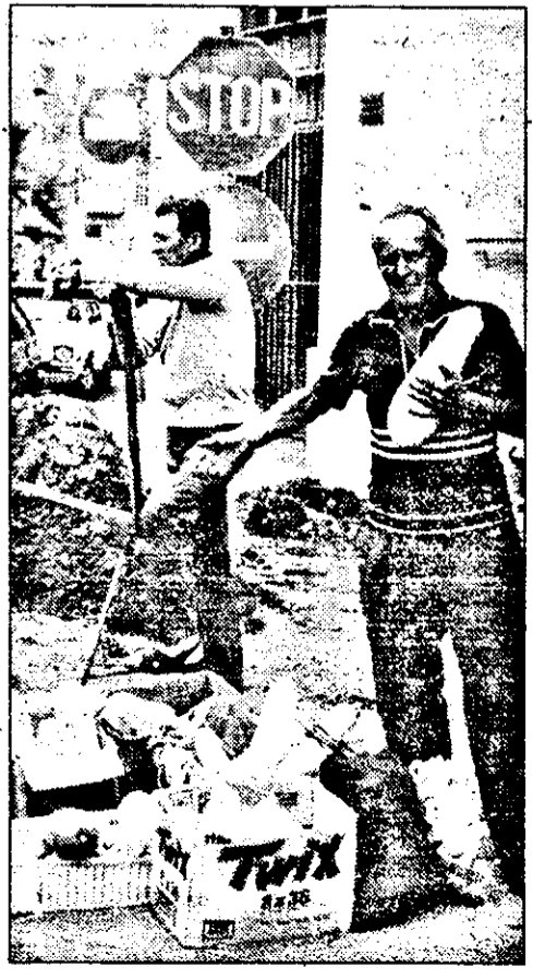
Piața ... în economia de piață

CĂMĂȘILE LUI NELSON MANDELA FAC FURORI LA LONDRA PAG. 8