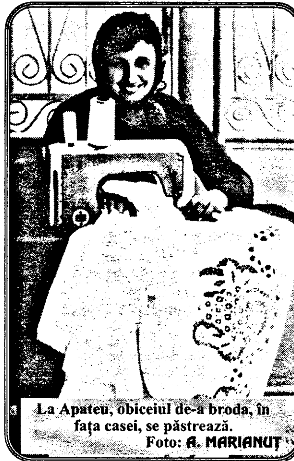
La Apaten, obiceiul de-a broda, în fața casei, se păstrează.

■ Paul McCartney crede în fantoma lui John Lennon, asasinat în decembrie 1980 de un... admirator. Paul pretinde că John apare foarte des noaptea, la ora 3, la căpătâiul patului său. Prima dată, zice cântărețul, mi-a fost frică, dar acum m-am obișnuit. Îmi place să pâlăvrăgim împreună.