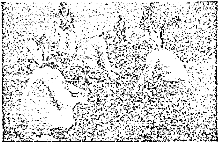
La asociația legumicolă Pecica se lucrează din zădărnici la plantatul salatăi.

sînt utilizate spațiile de producție, de cazare, gospodăriile anexă, cum se realizează prevederile privind autoaprovizionarea. Vor fi experimentate rețete alimentare tradiționale. Vizitele din cursul zilei de azi vor fi urmate, miercuri, de o dezbateră cu participarea celor prezenți, discuții care se vor constitui și ca un schimb de experiență între unitățile similare din județele participante.