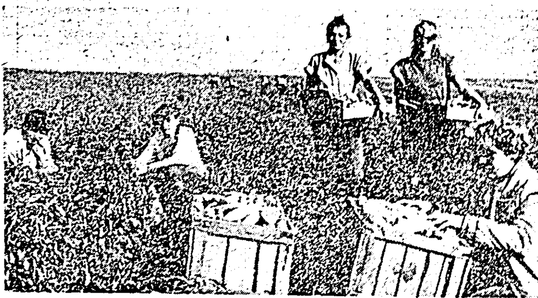
La recoltatul ardeiului copă, alături de muncitorii participă și eleve aflate în vacanță (cele trei din mijloc).