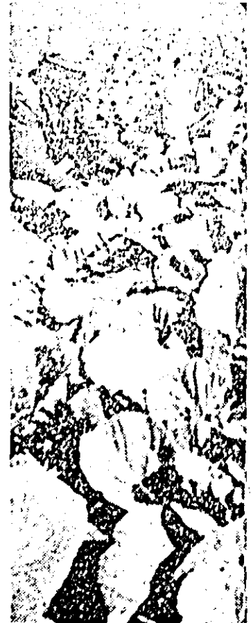
Șeful fermei nr. 11, Ionuț Schaler (în stînga imaginii) constată că varza se dezvoltă în bune condiții, plantele sînt sănătoase și vișuroase.