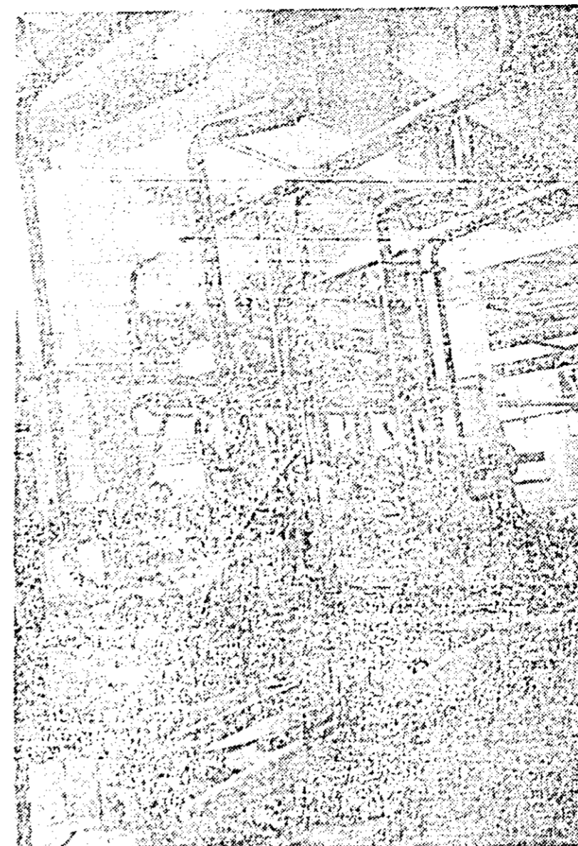
Din modernizările efectuate în ultima vreme la Uzina electrică din orașul nostru, modernizări care au dus la o simțitoare dezvoltare a capacității de producție a uzinei, face parte și stația de epurare chimică a apei.

Tractoristul a dat din umeri nepăsător. În cele din urmă a promis că va merge la secerat. Dar după-amiază secerătoarea continua să stea neclintită la locul ei, lîngă centrul gospodăresc, semn că tractoristul nu s-a obosit să ducă la îndeplinire ceea ce a promis. Tot la sediul brigăzii