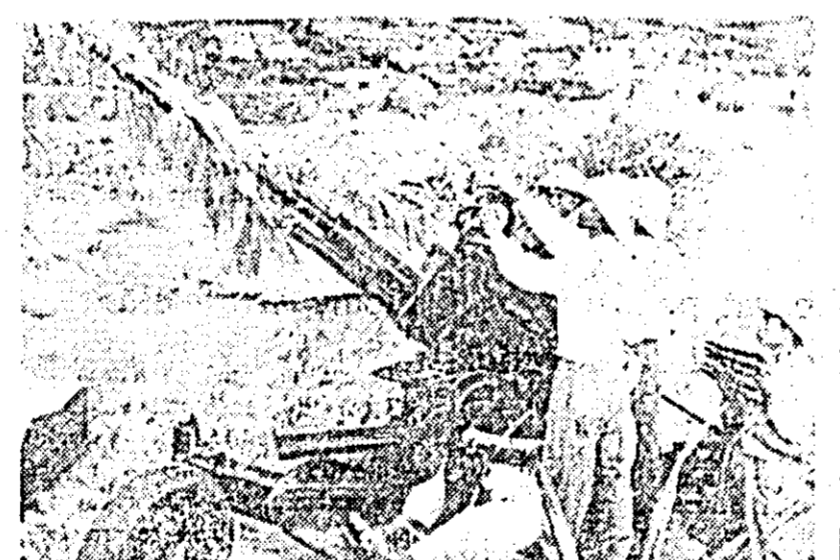
În RD Vietnam poporul este ferm hotărît să-și apere patria împotriva deselor bombardamente întreprinse de aviația americană. Soldații armatei populare sînt mereu gata să împlinească misiunea...