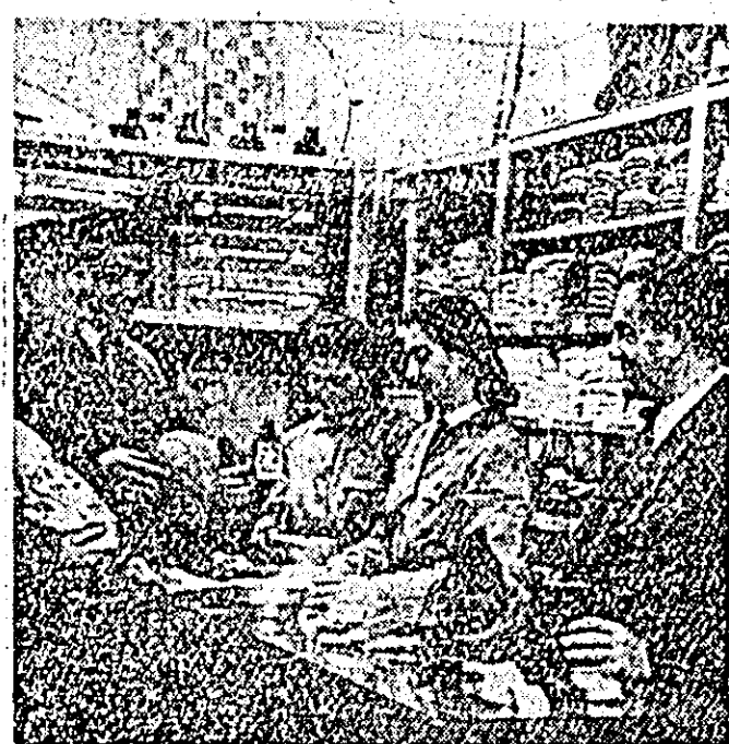
IN CLIŞEU: Aspect din magazinul de articole şi materiale sportive din oraşul nostru.

Pentru prima dată, în acest an s-au produs în ţara noastră bocanci de schi şi hanorace pentru copii şi patine pentru patinaj artistic.