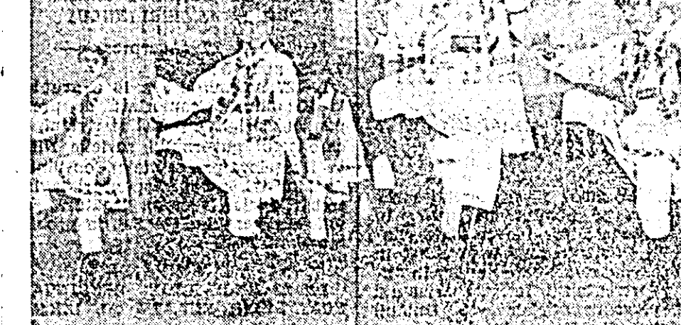
Echipa de dansuri populare de la CFR e bine cunoscută de publicul arădean. Formată din tineri entuziaști, echipa și-a câștigat aprecierea unanimă. Iată-o evoluînd în intr-un dans popular pe scena Palatului cultural.

Economisirea metalului este obiectivul chemării tinerilor rezistenți către toți tinerii din regiune. Printre organizațiile UTM ce au răspuns cu entuziasm acestei chemări se numără și organizația UTM a fabricii „Josif Kangeț”. Entuziasmul tinerilor constructori de strunguri nu s-a manifestat însă numai la ședința cu prilejul formulării răspunsului la chemare. El animă și acum pe utemiștii și tineri