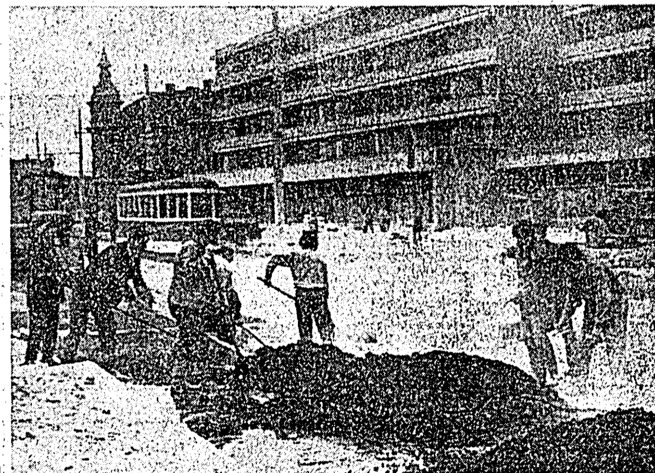
În Piața gării lucrările de modernizare se desfășoară din plin.

Este cunoscut că teroarea dezlănțuită împotriva celor care au hotărît crearea partidului comunist s-a extins în toată țara. La Arad, ancheta s-a oprit indeosebi la „Astra”, unde se urmărea să se afle cum a reușit Gheorghe Pincotan să plece la congres. Au fost anchetați numeroși muncitori, s-au operat arestări. Ministrul Trancu-Iași, care venise atunci la Arad, a declarat că mișcarea muncitorească a ajuns la un punct mort în urma congresului de la București. Aceasta n-a intimidat însă pe nimeni. Muncitorii arădeni trimisii președintelui Adunării deputaților o scrioară de protest, prin care cerea celor arestați să fie puși în libertate. Presa muncitorească arădeană publica numeroase articole sub titlul „Congresul arestat”, prin care informa despre situația celor arestați. Astfel, la 24 iulie 1921 se arată într-un articol că „tovarășii noștri au declarat greva foamei la Jilava”. Alături de cei la Ploiești, Brașov, Craiova, Turnu Severin, Focșani, Cîmpina, au avut loc numeroase manifestații de masă, care cereau eliberarea