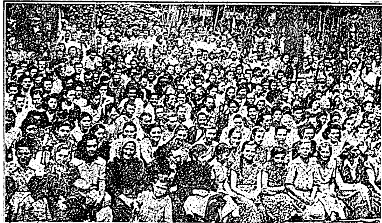
La mitingul femeilor din Arad, în cinstea Congresului Mondial al Mamelor, peste 3.000 mame, muncitoare, intelectuale, Țăranii muncitoare și gospodine din orașul nostru și delegate din raioane și-au manifestat hotărîrea de a apăra pa pace pentru liniștea căminelor și viața copiilor lor. În clișeu: aspect de la mitingul femeilor care a avut loc în parcul Sfatului popular regional Arad.