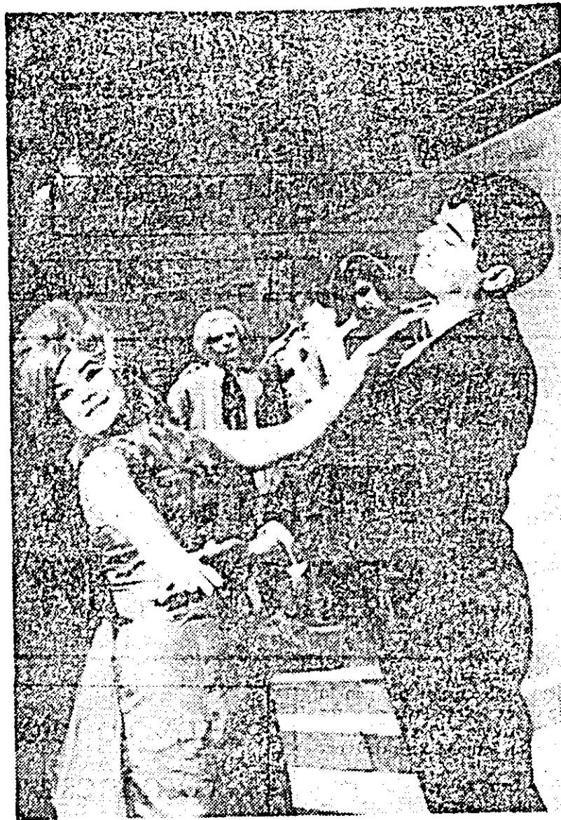
IN CLIȘEU: Cireșică și una din eroinele viselor sale.

Despărîndu-ne de Laurențiu Cerneș și de regizorul Constantin Anatol, le-am urat o frumoasă reușită, dorință ca publicul să răsplătească cu prisosință efortul lor și încrederea că servesc sincer frumosul și viața, aspirația spre mai bine, spre mai înalt.