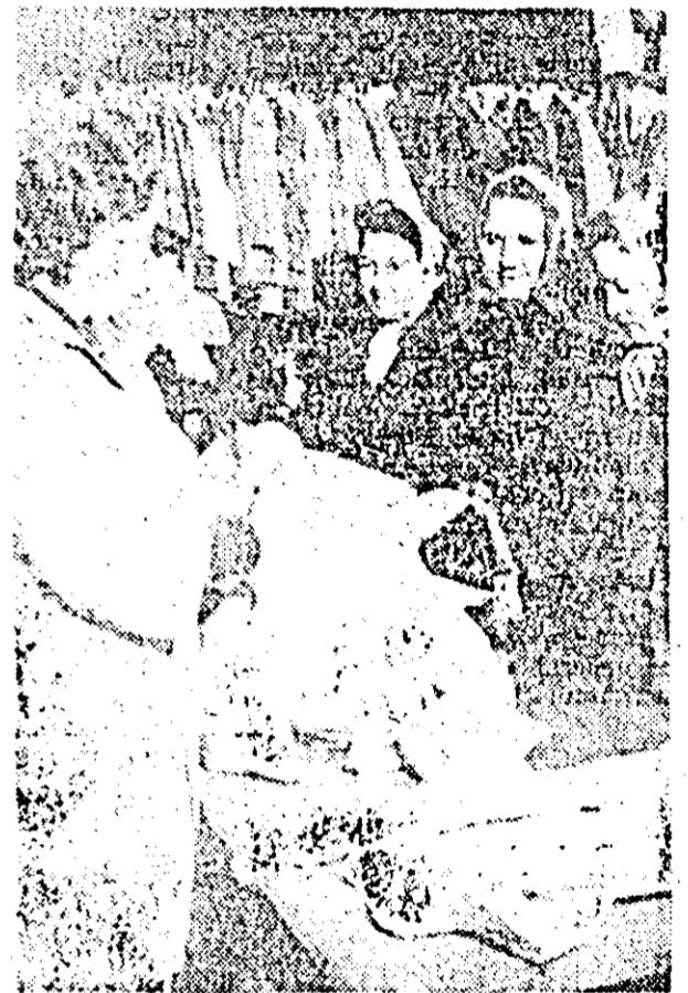
Magazinel de confecții pentru copii, situat pe str. Cernel nr. 2-4, este bine aprovizionat cu tot felul de paltonașe, pardesie, costume și alte confecții de calitate.

Noul sistem creează, de asemenea, condiții ca normatorii să fie scutiți de activitatea de repartizare și calculare a cheltuielilor. Aceștia completează, împreună cu maeștrii și atașamenții, numai normele compuse și cantitățile executate, stabilind totodată nivelul de îndeplinire a planului de către echipe. Restul operațiilor se fac de către calculatori și se trec direct în statele de plată. Sistemul poate fi aplicat pe toate șantierele de construcții și montaje din țară.