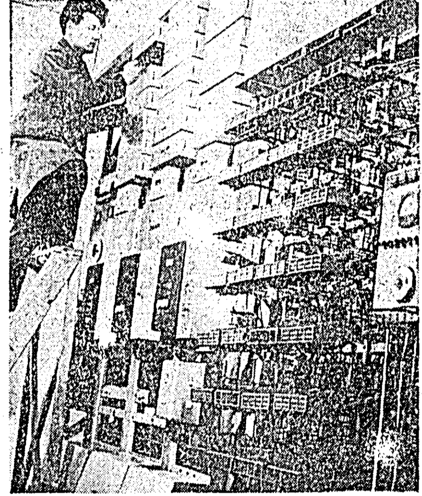
Sectorul CED al Secției CF 2 CFR. Electromecanicul Gh. Crișan verifică atent funcționarea rețelilor de la repetitor.