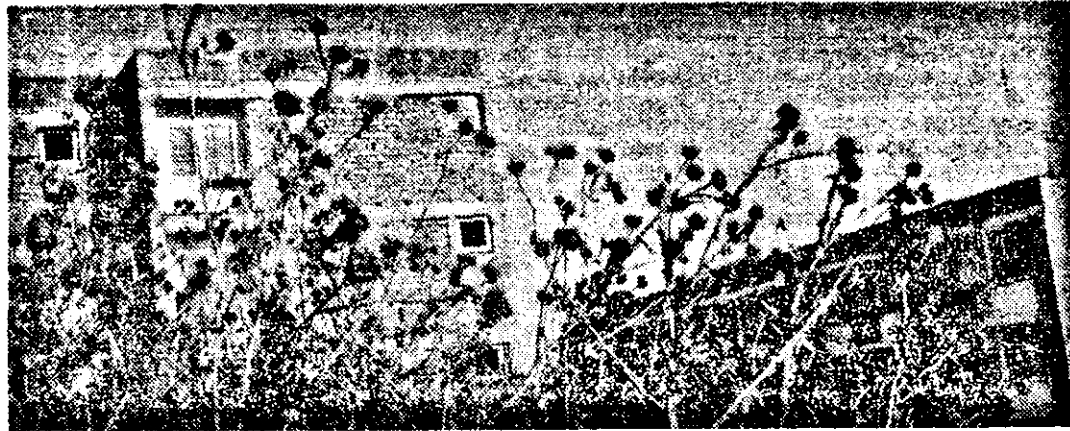
Deocamdată aceasta este imaginea „campusului universitar”.

număr restrîns au dat admisiuni şi au reuşit în învăţămîntul de stat şi au plecat. Era normal.