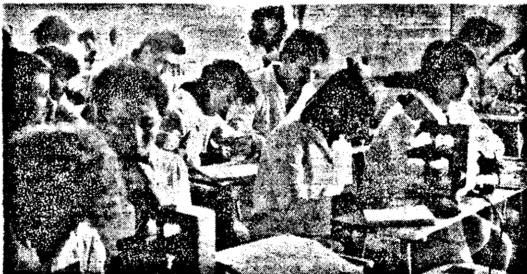
Cursuri și aplicații practice în laborator

În Arad există două universități: o universitate de stat, Universitatea „Aurel Vlaicu”, în cadrul căreia funcționează și Facultatea de Teologie Pastorală și o universitate particulară, Universitatea „Vasile Goldiș”, care înglobează și un Colegiu de Stomatologie și Tehnică Dentară. În cadrul Facultății de Inginerie a Universității „Aurel Vlaicu” se studiază mai multe profile: mecanic, textile-pielărie, chimie și alimentară. Există numai în vîntămînt de zi, cei trei ani de studiu cuprinzînd 495 de studenți. Facultatea de Teologie pastorală are două secții: teologie pastorală și teologie litere, cursuri de zi și fără frecvență. În total, 130 de studenți. Universitatea particulară „V. Goldiș” este cea mai „populată”, 1130 de studenți studiază dreptul,