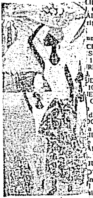
Una din reușitele lucrării pozitivei.