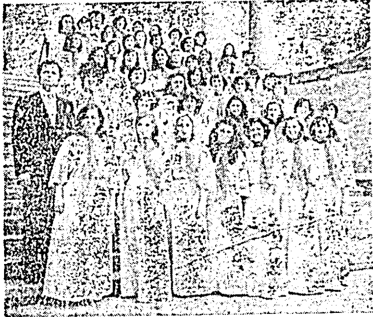
Corul de voci egale de pe lângă Clubul tinerețului.